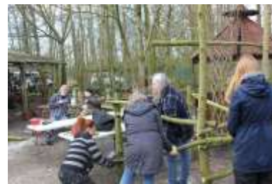
Fra Påsken 2017

Påsken nærmer sig med hastige skridt, og hos Birkelev NaturKunst er de i fuld gang med at planlægge det årlige påskearrangement.