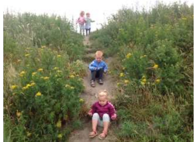
Krudtuglerne på Rømø i juli måned

Det er også vigtigt fortsat at undgå at smide cigaret-skodder, tomme dåser og flasker i naturen.