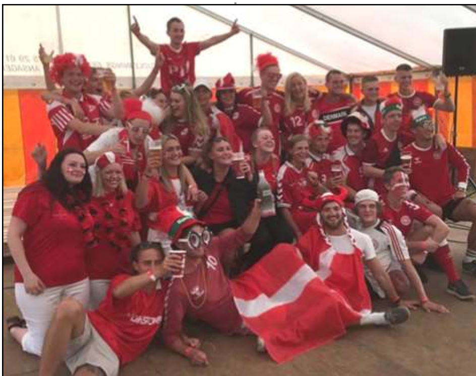
Deltagerne ved det vindende bord

Fredag stod i fodboldens tegn og fællesspisning: 7 hold var meldt til 7 mands fodbold. Det endte uafgjort mellem Frifelt Old Boys og